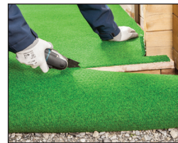
인조잔디 커팅 시 한 손으로 간편하게 작업 가능