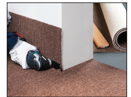
산업용 & 가정용 카펫 커팅을 쉽고 빠르게 할 수 있음