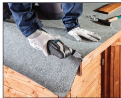
신축성 있는 연마재 커팅을 쉽고 빠르게 할 수 있음 (예: 펠트지)