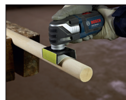
둥근 자재에 최적화 (예: 원기둥)