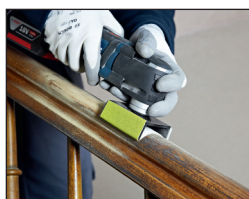
난간 샌딩을 효율적이고 편리하게 할 수 있음